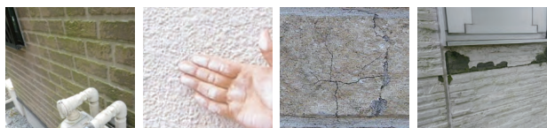
艶落ちや苔、退色や白亜化カビ等の汚れ (チョーキング現象) ひび割れ 塗膜の剥離