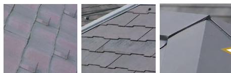
色落ち、汚れ 苔やカビの繁殖 ヒビや欠け、隙間の広がり

普段、意識しないことも多い屋根部分は、確認を忘れがちです。ぜひこの機会にチェックを！